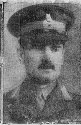
do Jefe del Estado Mayor Imperial Británico, apenas tiene 45 años. Ingresó al ejército durante la guerra pasada con menos de 18 años de edad.