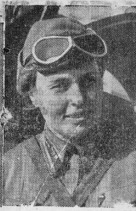
avión de ambulancia en el Ejército Ruso. Es ella típica de las muchas mujeres rusas en las Fuerzas Armadas; el Mayor General A. E. Nye, M. C., Segun-