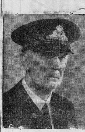
Una nueva fotografía del Almirante Diesen, Jefe de las Fuerzas Navales Noruegas en la Gran Bretaña; Primer Teniente Polina Sedova, piloto de un

V El Gobierno concede a la Compañía el derecho de importar, libre de derechos de aduana e impuestos o cargos fiscales, marítimos o terrestres, inclusive el muellaje, las semillas, vástagos y plantas vivas de abacá y las maquinarias, materiales, combustibles, lubricantes, forrajes, abonos, fungicidas e insecticidas o las sustancias químicas para su preparación, y los equipos y accesorios necesarios para la siembra, cultivo, beneficio y explotación de sus plantaciones de abacá y para la construcción, mantenimiento