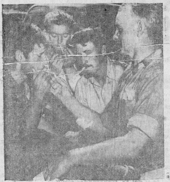
Un grupo de prisioneros italianos, a los que les ha ido tai mal en esta aventura trágica de la guerra, encienden los primeros cigarrillos que pueden obtener de manos inglesas desde hace muchos años